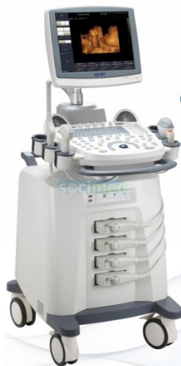
échographe : 14.000 €

Association « Un Sourire pour le Togo » 19 rue du Geffental 68610 LAUTENBACH-ZELL