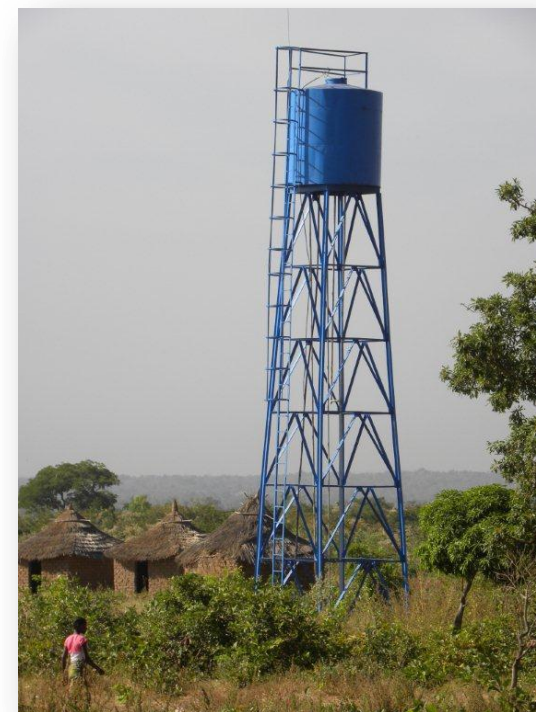
alimentation en eau pour 750 pers. : 9.000 €