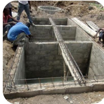
2014 Travaux préparatoires